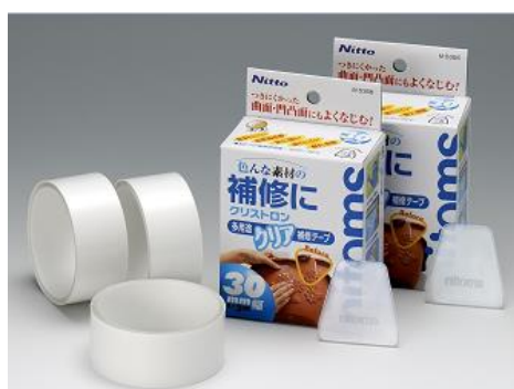
クリストロン 30 多用途クリア補修テープ