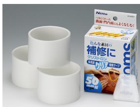
クリストロン 50 多用途クリア補修テープ