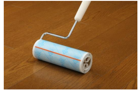
「コロコロ フロアクリンスカットカット」

一方、『コロコロ フロアクリンスカットカット』は、カーペットはもちろんのこと、一般的な粘着クリーナーでは清掃できないフローリングやタタミ、ビニール床なども清掃できるマルチユースな製品です。様々な床に使用できるのは、フローリングなどの平滑面には貼りつかない弱粘着層と、カーペットの奥まで入り込む強粘着層の2種類の粘着剤を使用した「W粘着」という当社独自の技術が活かしているからです。本製品もシート交換時にストレスフリーな「スカットカット」を搭載しています。