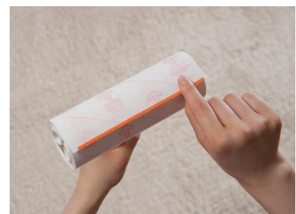
「コロコロ ハイグレードスカットカット強接着」

対象製品の『コロコロ ハイグレードスカットカット強接着』は、『コロコロ』の中で一番のゴミ捕捉力を誇る当社の販売実績 No.1 製品です。カーペットやソファなどのファブリック製品の繊維の間に入り込んだ細かいホコリやダニもキャッチする「スパイクドット粘着加工」を採用しています。また、シート交換時にめくり口がわかりやすく、切り取りやすい、ストレスフリーな「スカットカット」も搭載しています。