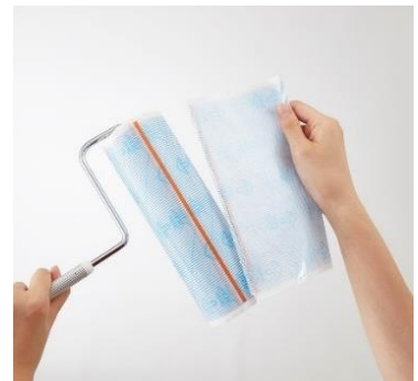
「テープがめくりにくい」というユーザーボイスから生まれた機能

当初はカーペット専用の清掃用品でしたが、人々の住環境の変化に寄り添った開発を続け、フローリングやタタミにも使える『フロアクリン』シリーズや、スマートフォンの画面の皮脂汚れを除去する『指紋コロコロミニ』など、用途に合わせてラインアップを拡充しています。ゴミがついた後でもめくり口がすぐわかり、スパッと気持ちよく切れる「スカットカット」機能や、テープ交換をしやすい独自の本体設計など、ストレスフリーに使える工夫を凝らし、毎日のお掃除をより愛される行動へと進化させることができるよう、日々製品の開発、改良に取り組んでいます。