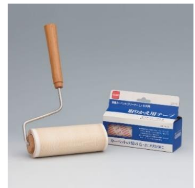
初代のコロコロ （粘着カーペットクリーナー）