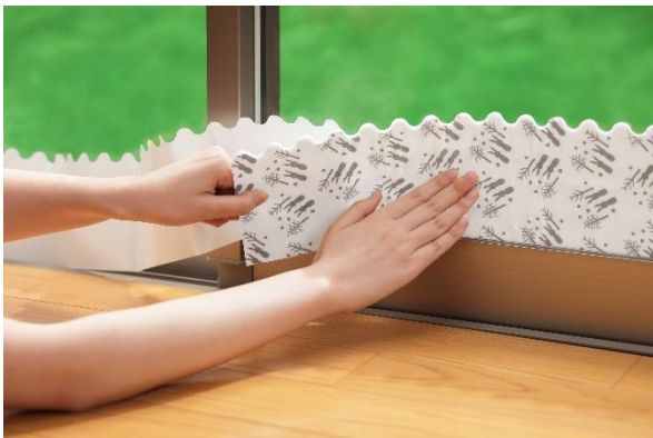
貼るだけで簡単に結露対策(幅 120mm タイプ使用時)

株式会社ニトムズ（本社：東京都品川区、代表取締役社長：右近敦嗣）は、窓に貼るだけで、結露をしっかり吸水する「強力結露吸水テープ スノーラビッツ」2サイズを2024年8月1日(木)に発売します。ウサギと雪をあしらった、シンプルでやさしい北欧調のデザインで、部屋を彩りながら結露対策ができます。