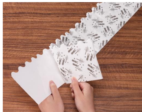
テープの両面に、イラストを印刷