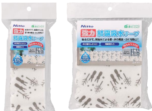
幅 60mm と 120mm の 2 サイズ展開