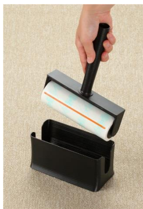
片手でサッと 取り出せる