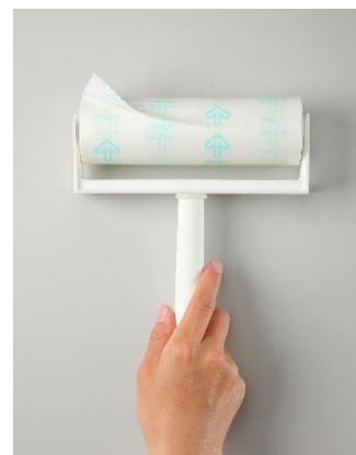
付属のテープは、スカットカットタイプと ミシン目入りタイプの 2 種類