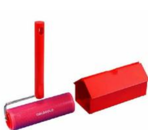
本体と同色のスペアテープ

「コロコロコロフル」は、フローリングにも最適で、カーペット・畳・ビニール床とどんな床にも使える「フロアクリン」タイプのテープを採用。実用的でデザイン性を兼ね備えたお掃除グッズです。