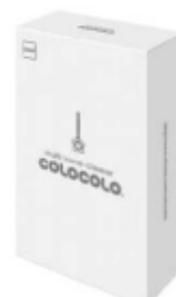
ギフトボックスに入って、プレゼントされた方は、開けるまでのお楽しみ